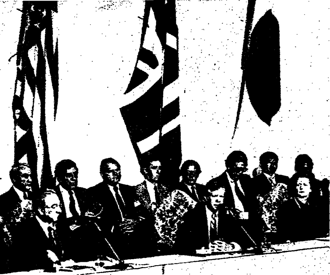
الرئيس كارتر يدلي ببيان في اختتام مؤتمر القمة الاقتصادية في البندقية والى يساره رئيسة الحكومة البريطانية السيدة مارغريت تاتشر والى يمينه رئيس الحكومة الإيطالية فرنسيسكو كوسيجيا

وعدت الدول الصناعية السبع بالتصديق على ارتفاع أسعار إنتاجها من الطاقة المحلية تشيخا مع الأسعار العالمية. كما دعا البيان إلى زيادة الاستثمارات في مجالات الطاقة حيث أن ذلك سيسهم بدوره في زيادة الرخاء الاقتصادي. كما تعهدت هذه الدول الصناعية بخفض التضخم الاقتصادي. وذكر البيان المشترك الصادر عن المؤتمر أن هذا الموضوع يحظى بأهمية خاصة.